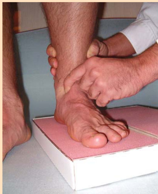
Figura 2. Técnica de molde en carga controlada